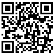
คู่มือการใช้งาน e-Request