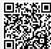
วิดีโอการใช้งานระบบ Inventech Connect

*หมายเหตุ การทำงานของระบบประชุมผ่านสื่ออิเล็กทรอนิกส์ และระบบ Inventech Connect ขึ้นอยู่กับระบบอินเทอร์เน็ตที่รองรับของผู้ถือหุ้นหรือผู้รับมอบฉันทะ รวมถึงอุปกรณ์ และ/หรือ โปรแกรมของอุปกรณ์ กรุณาใช้อุปกรณ์ และ/หรือโปรแกรมดังต่อไปนี้ในการใช้งานระบบ